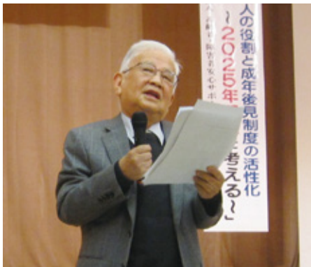
『市民後見人の役割と成年後見制度の活性化～2025年問題を考える～』（第1部講演）