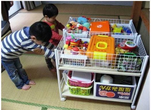
子ども達も自分で出し入れ♪