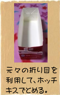
元々の折り目を利用して、ホッチキスでとめる。