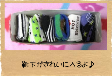
靴下がきれいに入るよ♪