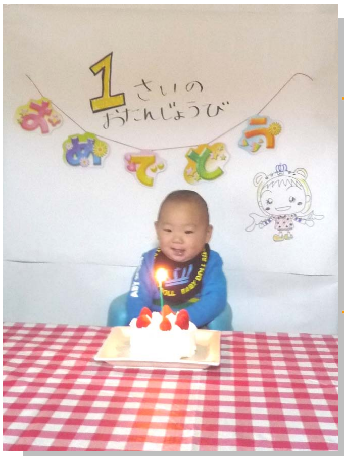
カラー写真でお見せできないのが残念です。 カラーで見たい方はこちら… URL : http://kama.syakyo.com/kamappi

年に一度のシャッターチャンス！こどもが『ふう～』っとろうそくを 吹き消すところを撮るのもオススメです！