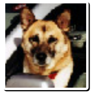
サンちゃん(8才) 【雑種・メス】

法律相談については、現在調整中ですので、詳しくは嘉麻市社会福祉協議会本館(電話42-0751)まで、お問い合わせ下さい。 相談会場については、3月27日以降の建物名称で記載しています。