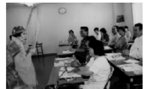
ボランティア入門講座（山田市）

ボランティア・市民活動のいろいろう 支えあい、学びあえる市民相互の関係づくりをすすめる、誰もが豊かに暮らしていける地域社会をめざします。