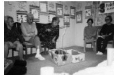
レクリエーションを楽しむ利用者の皆さん