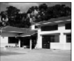
稲築西児童館・学童保育