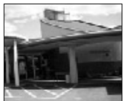
ふるさと交流館なつきの湯