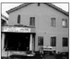
グループホーム・デイサービスよかとこの家