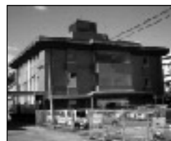
稲築町住民センター・母子健康センター