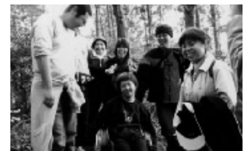
長谷山ふれあい登山（碓井町）