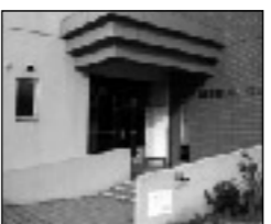
嘉穂町老人福祉センター