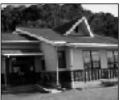
稲築東児童館・学童保育