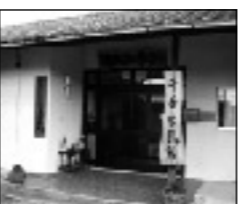
嘉穂町千手公民館