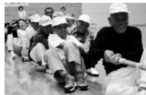
さわやか運動会（嘉穂町）