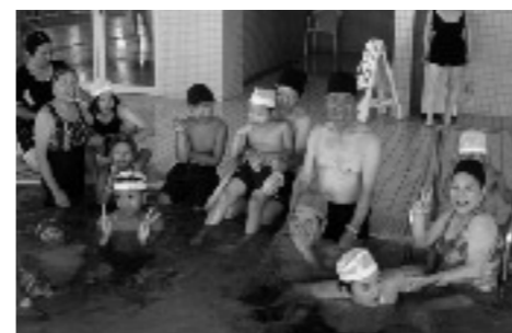
ゆうあい～YOU&事業（稲築町）