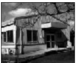
旧はぐるま工芸舎