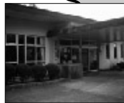
稲築町社会福祉センター