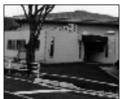
山田市ふれあいハウス